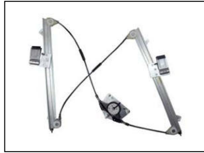
Nostro alzacristallo – our window regulator – notre lève-vitre – unser Fensterheber – nuestro elevalunas – nosso levantador de vidro - bizim cam acacagi - Γρύλος δικός μας